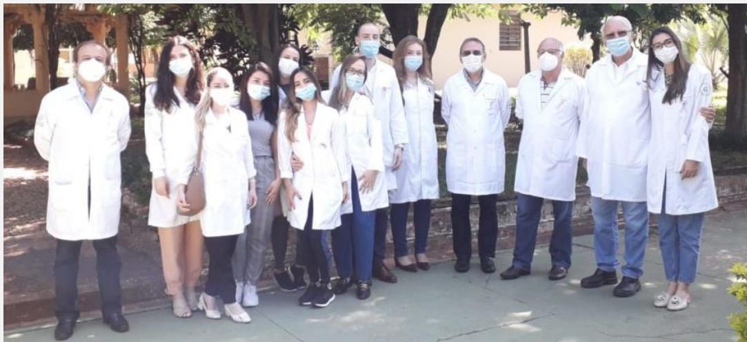
Profissionais do ILSL utilizam os laços da AAL e apoiam a campanha Janeiro Roxo